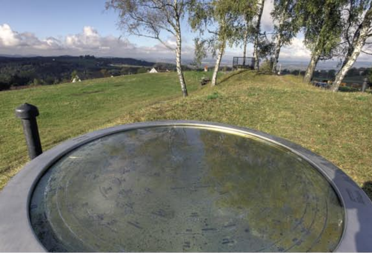
↑ Blick von der Haube, dem höchsten Punkt der Tour