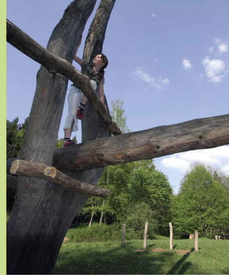
Klettern am Spielplatz Steinbachtal

Information: www.althuette.de , Telefon: 07183/95959-0