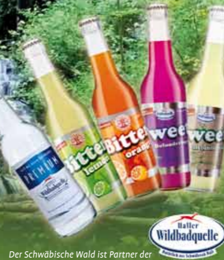
Der Schwäbische Wald ist Partner der

Sagen Sie dem Alltag Lebewohl und genießen Sie erholsame Tage in und mit der Natur. Auf Ihren Besuch freut sich Ihre Fremdenverkehrsgemeinschaft Schwäbischer Wald