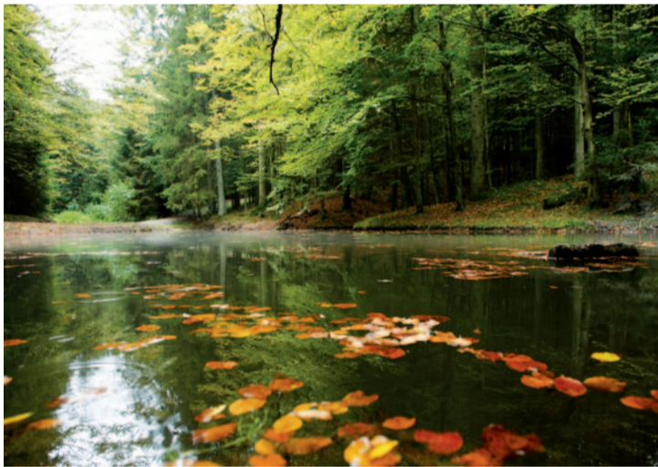
Leben in Balance.