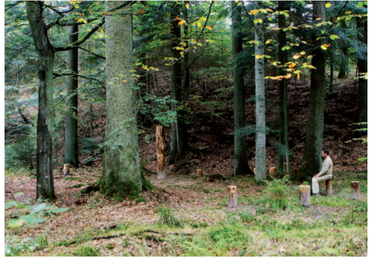
Ruhe, Meditation, Einkehr.