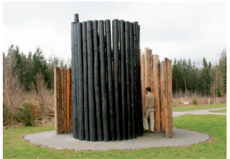
Schmerz, Tod, Trauer.