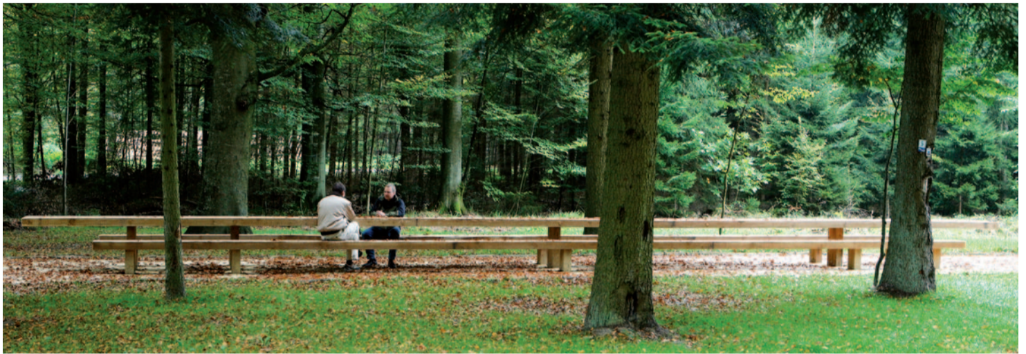
In Gemeinschaft friedlich stark.