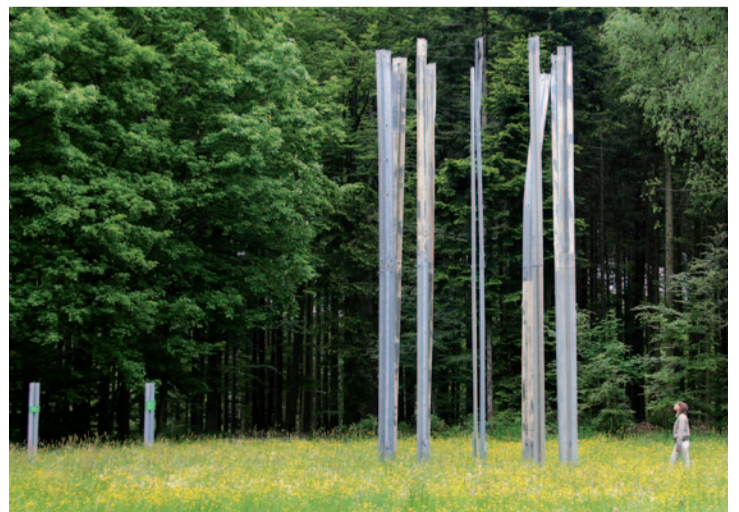
Schutz durch Regeln.