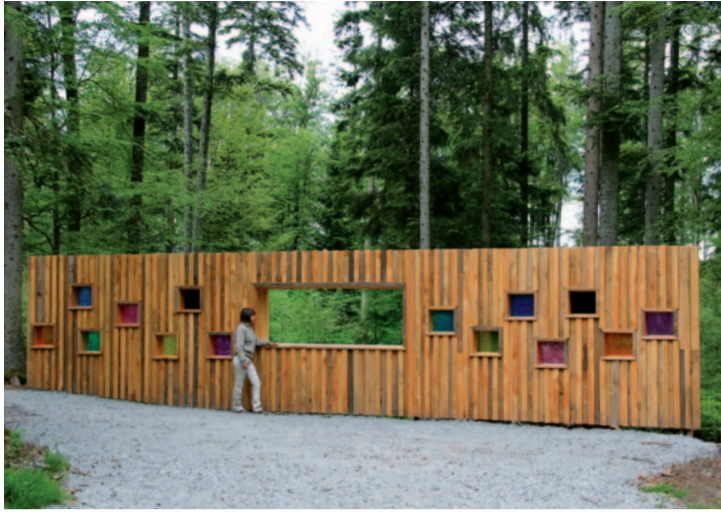
Ankommen, abschalten, Natur sehen.