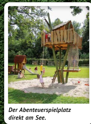
Der Abenteuerspielplatz direkt am See.